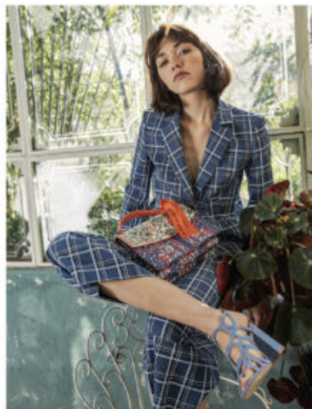
Borsa a mano in tessuto fantasia, La Pandorina, € 88. Sandali in cuoio, Primavera Collection, € 49,99. Completo a righe, Caren-Mia, € 229 in ginocchio e € 129 il pantalone. Nella pagina accanto: Tracolla in scotch bicolor, Braccialini Yoo, € 99. Green in nylon, 89 by Sibrian Hoesli, € 29,99. Shorts in viscosa, Kasa, € 49,90.