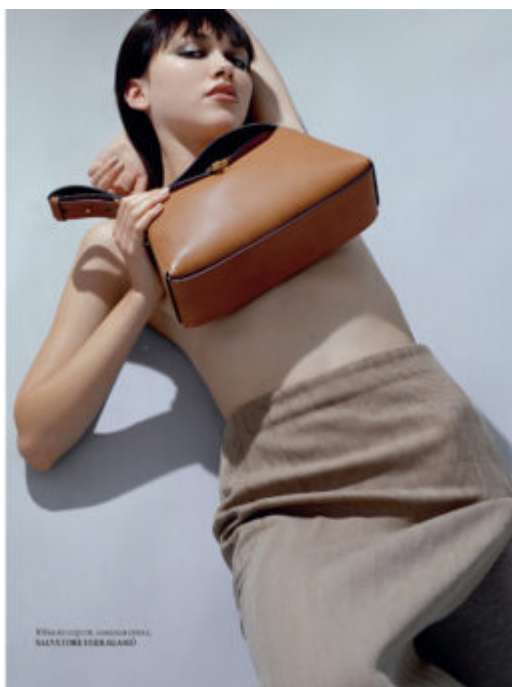
Wella-ROCCO, L'AMORE È UN SALVATORE (SERIE)